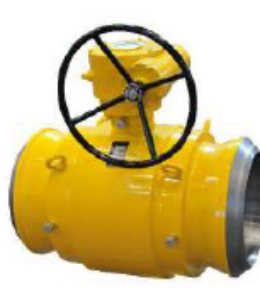
Кран шаровой цельносварной

WCB LCC CF8 CF8M CF3 CF3M LF2 A105 304 316 304L 316L