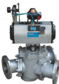
Кран шаровой трех-, четырехходовой