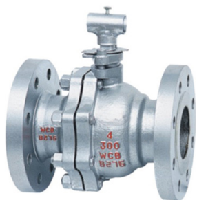
Кран шаровой с плавающей пробкой