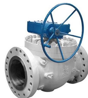
Кран шаровой с верхней крышкой