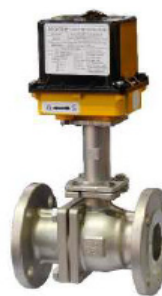
Кран шаровой криогенный

WCB LCC CF8 CF8M CF3 CF3M LF2 A105 304 316 304L 316L