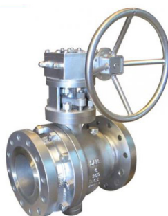
Кран шаровой с уплотнением металл-металл