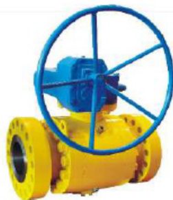
Кран шаровой с пробкой в опорах

WCB LCC CF8 CF8M CF3 CF3M LF2 A105 304 316 304L 316L